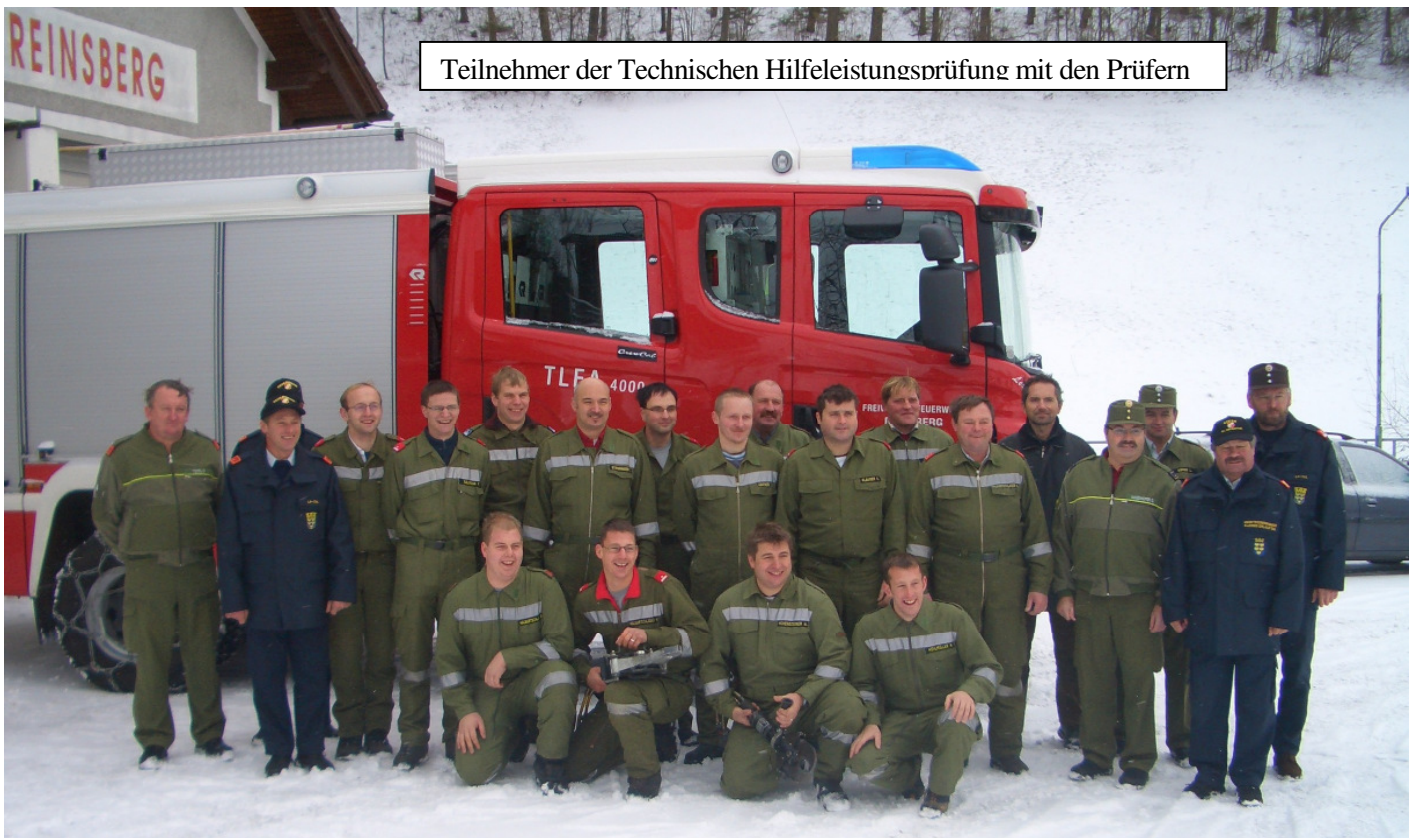
Teilnehmer der Technischen Hilfeleistungsprüfung mit den Prüfern